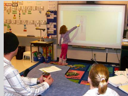
Esta foto de autor desconocido está licenciada bajo CC BY